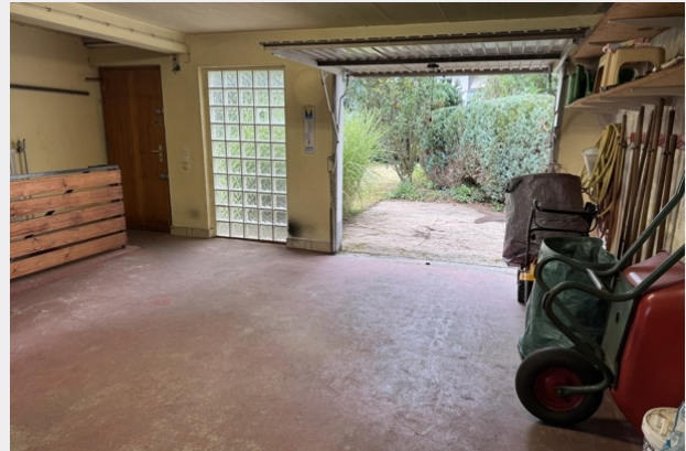
Garage mit Zugang Garten