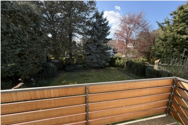
Blick von Balkon